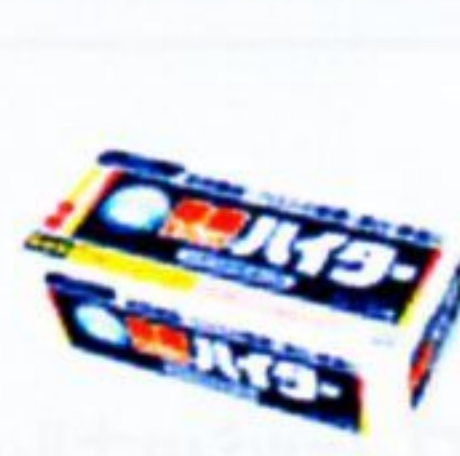
除菌タブレットハイター