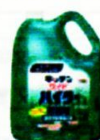
キッチンワイドハイター