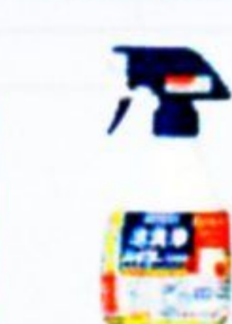
医療施設用泡洗浄ハイター1000