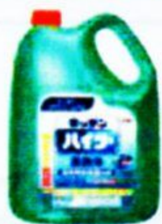
キッチンハイター