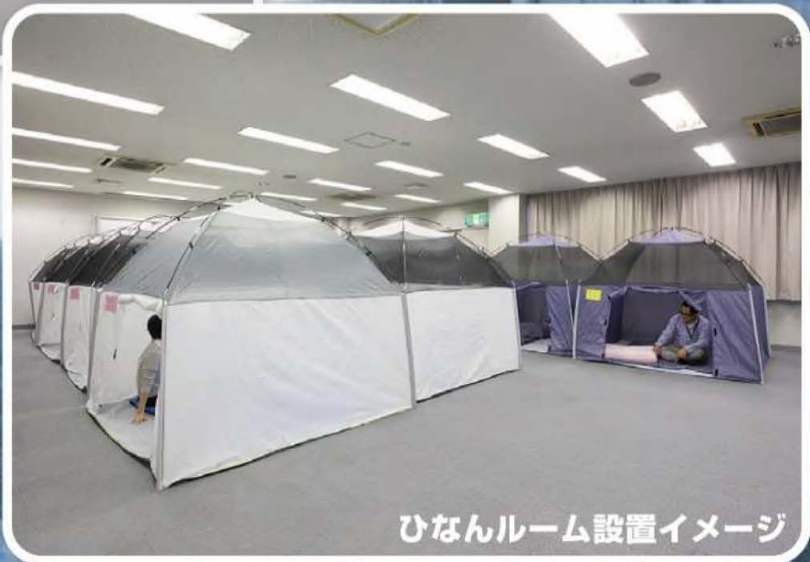
ひなんルーム設置イメージ