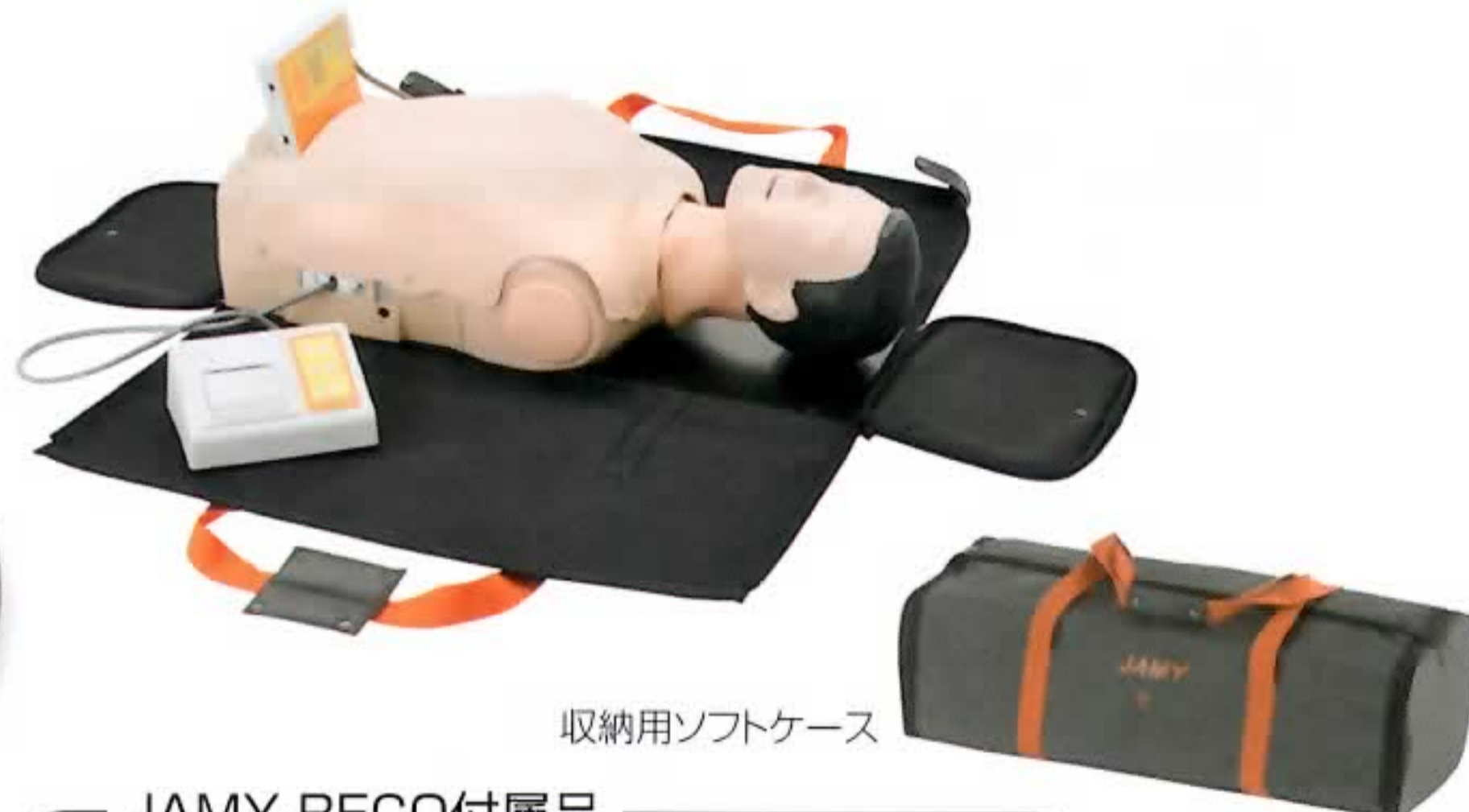
収納用ソフトケース