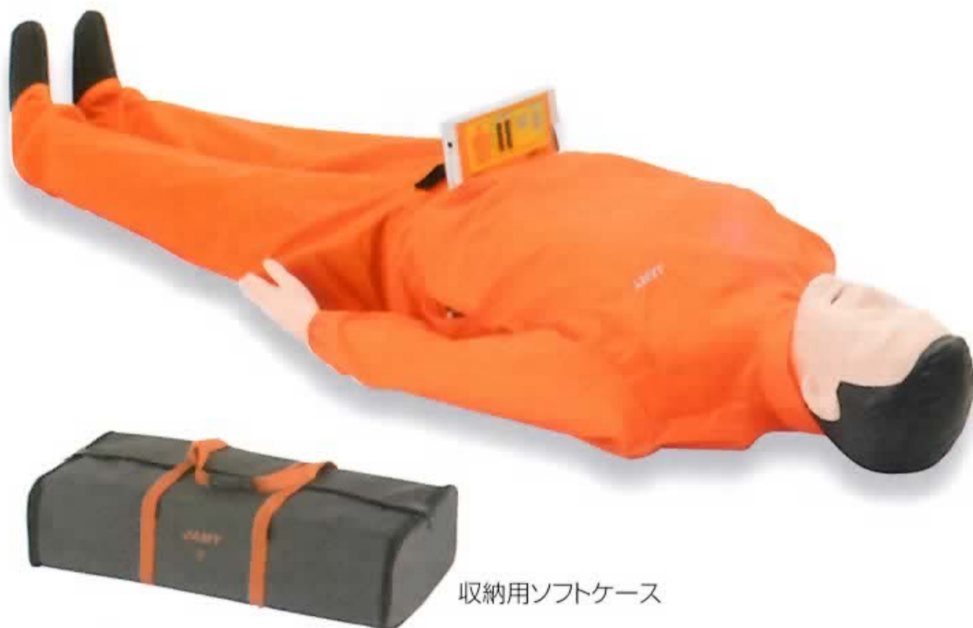
収納用ソフトケース

全長:約160cm 重さ:約10kg (収納ケース、付属品含む) ソフトケースの大きさ:約98 (幅)×50 (奥行)×25 (高さ) cm