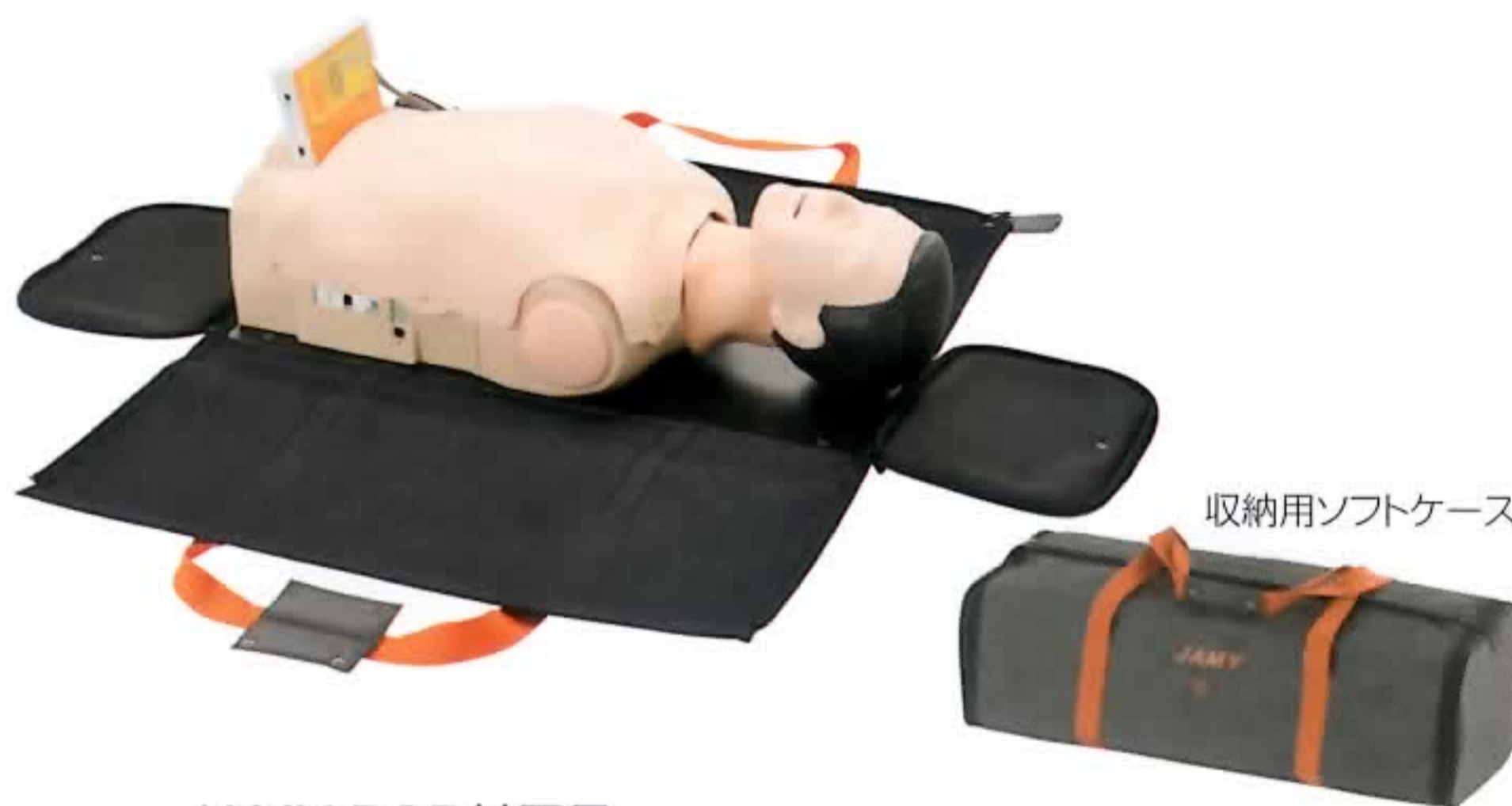
収納用ソフトケース

全長:約70cm 重さ:約7kg (収納ケース、付属品含む) ソフトケースの大きさ:約78 (幅)×35 (奥行)×25 (高さ) cm