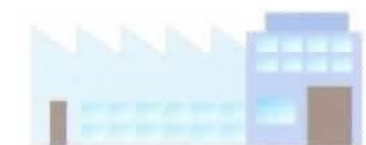
●医薬品・食品工場などの前室

他にも大変便利にご利用いただけます。●ホテル・旅館などの客室 ●事務所 ●会議室 ●温泉・銭湯の脱衣所 ●体育館 など