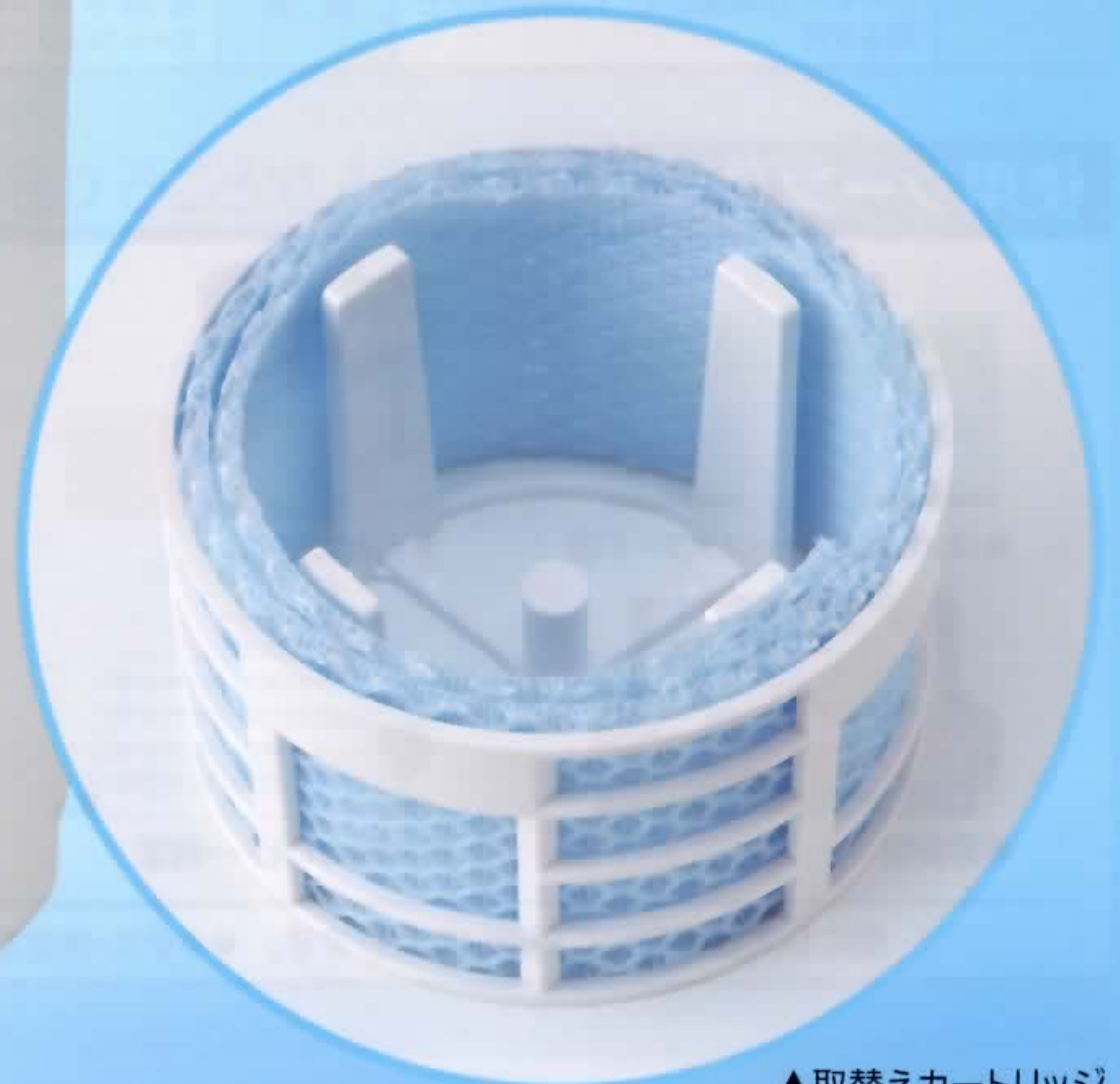
▲取替えカートリッジ