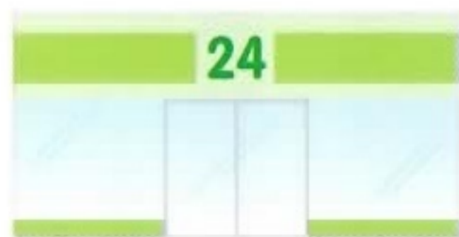
●コンビニ・ファーストフード店