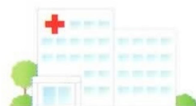
●病院のロビー・病室