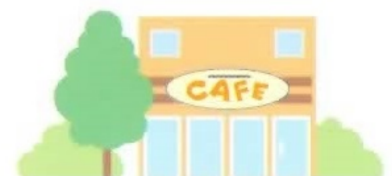
●喫茶店・居酒屋などの飲食店